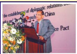
විදේශ ඇමති මහාචාර්ය පී. එල්. පිරිස් මහතා සනාථ ඇමරිම