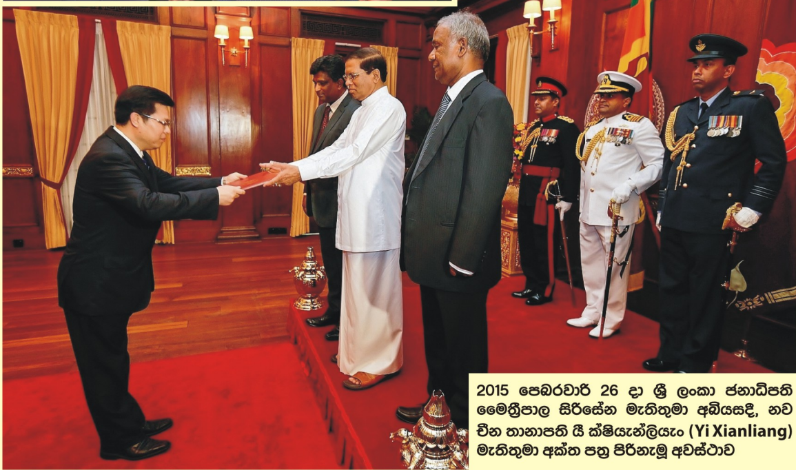
2015 පෙබරවාරි 26 දා ශ්‍රී ලංකා ජනාධිපති මෛත්‍රීපාල සිරිසේන මැතිතුමා අධ්යක්ෂ, නව චීන තානාපති ජී ක්ෂියැන්ලියෑං (Yi Xianliang) මැතිතුමා අත් පත් පිරිනැමූ අවස්ථාව