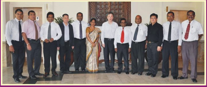
චීනයේ ජියැංෂි (Jiangxi) ප්‍රාන්ත පාලක මණ්ඩලයේ සභාපති හුආං යූජින් (Huang Yuejin) මහතා ප්‍රමුඛ නියෝජිතයන්, 2013 දෙසැම්බර් 5 දා ශ්‍රී ලංකා - චීන මිත්‍ර සංගමය විසින් කොළඹ සිහමන් ග්‍රෑන්ඩ් හොටලයේදී පිළිගැනීම