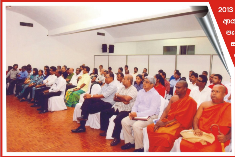
2013 මැයි 4 දා ශ්‍රී ලංකා පළාතේ ආයතනයේ ප්‍රධාන ශ්‍රවණාගාරයේදී පැවැති විශේෂ සාමාජික මහා සභාවට සහභාගිවූ සංගමයේ යාවජීව සාමාජික සමූහය