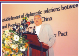
විපක්‍ෂ නායක රනිල් වික්‍රමසිංහ මහතා දේශනය පවත්වමින්