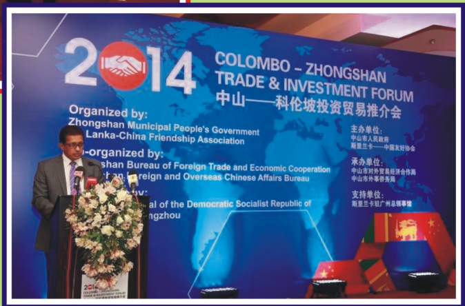
2014 අගෝස්තු 12 දා ටාජ් සමුද්‍රා හෝටලයේදී පැවැත්වූ ශ්‍රී ලංකා චුංශාන් ව්‍යාපාරික සමුළුව අමතා ශ්‍රී ලංකා - චීන මිත්‍ර සංගමයේ උප සභාපති ජනාධිපති නීතිඥ නිහල් ජයවර්ධන මහතා ආරම්භක දේශනය පවත්වමින්