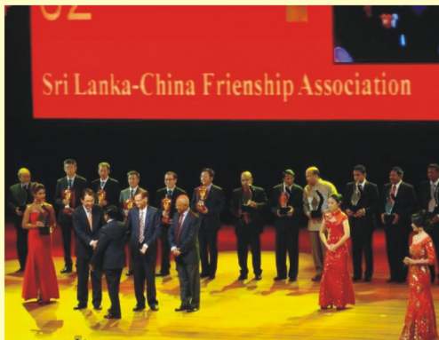
සම්මාන ප්‍රදානය කරා පියනැගීම