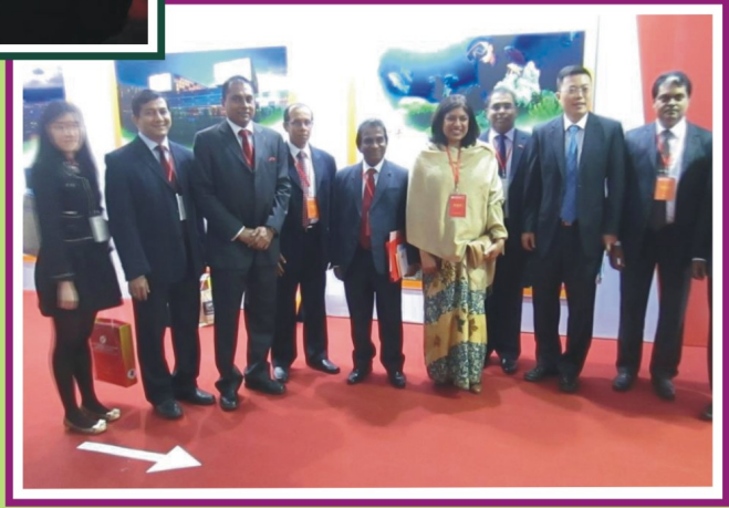
2013 මාර්තු මස චුංශාන් නුවරට ගිය ශ්‍රී ලංකා - චීන මිත්‍ර සංගමයේ නියෝජිත පිරිස සමග ගුණ්ගවු නුවර ශ්‍රී ලංකා කොන්සල් ජෙනරාල් යශෝජා ගුණසේකර මහත්මිය සහ චුංශාන් විදේශ කාර්යාලයේ උප නායක ජෝ චෂං ජුන්ගෞන්ග් (Joe Zhang Junfeng) මහතා.