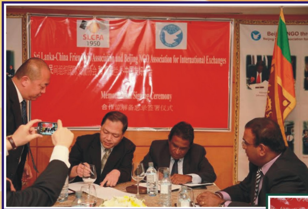
ශ්‍රී ලංකා - චීන මිත්‍ර සංගමය සහ ජාත්‍යන්තර භූවමාරු උදෙසා බෙයිජිං රාජ්‍ය නොවන සංගමය (Beijing NGO Association) අතර අවබෝධතා ගිවිසුම අත්සන් කිරීම