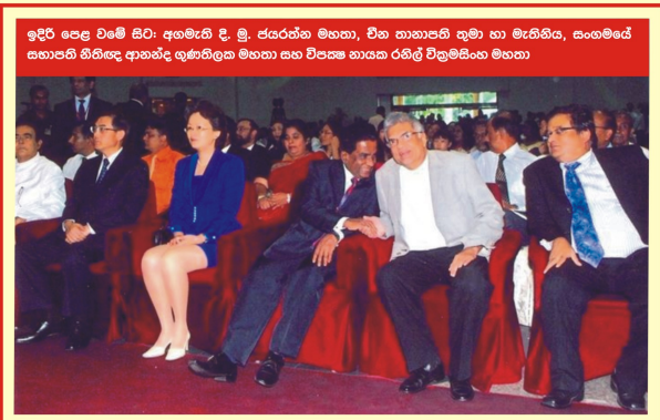
ඉදිරි පෙළ වමේ සිට: අගමැති දී. මු. ජයරත්න මහතා, චීන තානාපති කුමා හා මැතිනිය, සංගමයේ සභාපති නීතිඥ ආනන්ද ගුණතිලක මහතා සහ විපක්‍ෂ නායක රනිල් වික්‍රමසිංහ මහතා

චීන තානාපති වූ පියංහාඕ (Wu Jianghao) මහතා සනාථ ඇමරිතු මොහොත