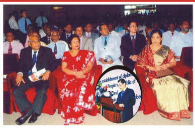
ජනාධිපතිවරයා නියෝජනය කරමින් අගමැති දී. මු. ජයරත්න මහතාගේ සම්ප්‍රාප්තිය හා සනාථ ඇමරිම