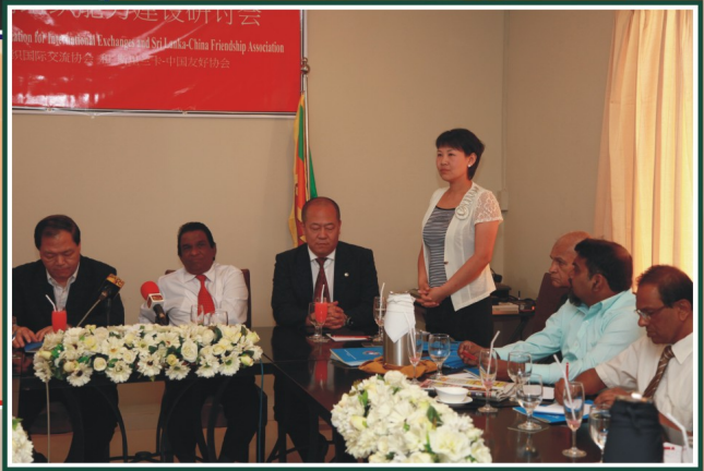
ශ්‍රී ලංකා - චීන මිත්‍ර සංගමයේ හා බෙයිජිං රාජ්‍ය නොවන සංවිධාන සංගමයේ (Beijing NGO) නියෝජිතයන් අවබෝධතා ගිවිසුමෙන් පසු