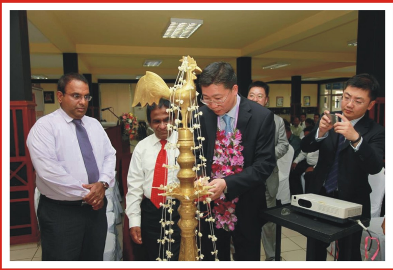
ලියු කයිසං (Liu Kaiyang) මහතා සම්ප්‍රදායික පහන දල්වමින්

ශ්‍රී ලංකා - චීන මිත්‍ර සංගමයේ සභාපති ප්‍රමුඛ නියෝජිතයන් හා CAFIU සංවිධානයේ මහ ලේකම් NI JIAN ප්‍රමුඛ නියෝජිතයන් ශ්‍රී ලංකා පාර්ලිමේන්තුවේ නියෝජ්‍ය කතානායක එන්දිම විරක්කොඩි මහතා පාර්ලිමේන්තුවේදී හමුවූ අවස්ථාව.