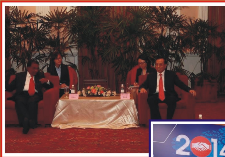
2014 අගෝස්තු 12 දා ටාජ් සමුද්‍රා හෝටලයේදී චුංශාන් නගරාධිපති චෙන් ලියැංශියාන් (Chen Liangxian) සමග ශ්‍රී ලංකා - චීන මිත්‍ර සංගමයේ සභාපති හා නිලධාරීන් සාකච්ඡා කිරීම